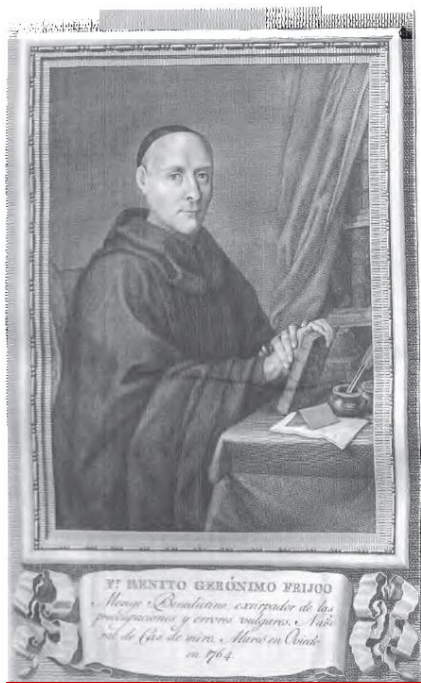
Monje Beneditino extirpador de las preocupaciones y errores vulgares. Natural de Casdemiro. Murió en Oviedo en 1764. [Grabado de José Vázquez por dibujo de José Maea para los Retratos de españoles Ilustres , 1798.

género literario, a la literatura española. El otro es el de difundir las nuevas ideas entre amplias capas de público; pero no el de ser el primero en profesarlas en España, pues le precedió todo ese movimiento filosófico, científico e intelectual que, a caballo entre los siglos XVII y XVIII, ha dado en llamarse «de los novatores », y en el que destacó Juan de Cabriada.