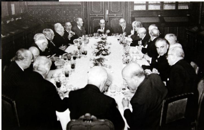
RAE: Almuerzo del Director – 11 enero 1954. 24 marzo: Discurso inaugural de la «Cátedra Feijóo».

Fue, ante todo, un autodidacto polígrafo que representó la causa de la literatura francesa. Uno de los autores más frecuentado fue Pierre Bayle, figura destacada de la primera Ilustración, con quién Feijóo compartió el gusto por la claridad, el talento de la exposición cautivadora y, sobre todo, el propósito de divulgar cómo lo que se tiene por prodigio es, con frecuencia, tan natural como las cosas más triviales. «Feijóo —escribe Maraión— no luchó contra las brujas, contra los endemoniados, contra los astrólogos o contra los médicos dogmáticos de su tiempo a los que dedicó, al igual que al profesorado universitario, sus palabras más duras; luchó contra el error supersticioso sin rozar jamás a su fe», aunque tuvo tropiezos con la Inquisición de la que le protegió